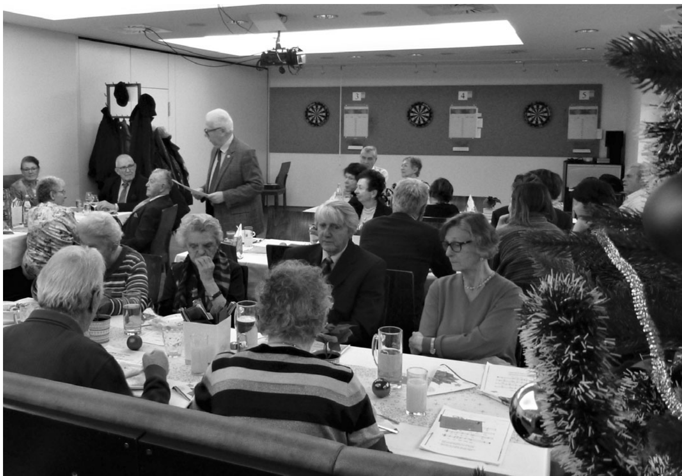
Bei der Weihnachtsfeier im „Donau City Treff“

Am 15. Dezember 2019 fand die Weihnachtsfeier der Landesgruppe Wien und Senioren / Wien statt.