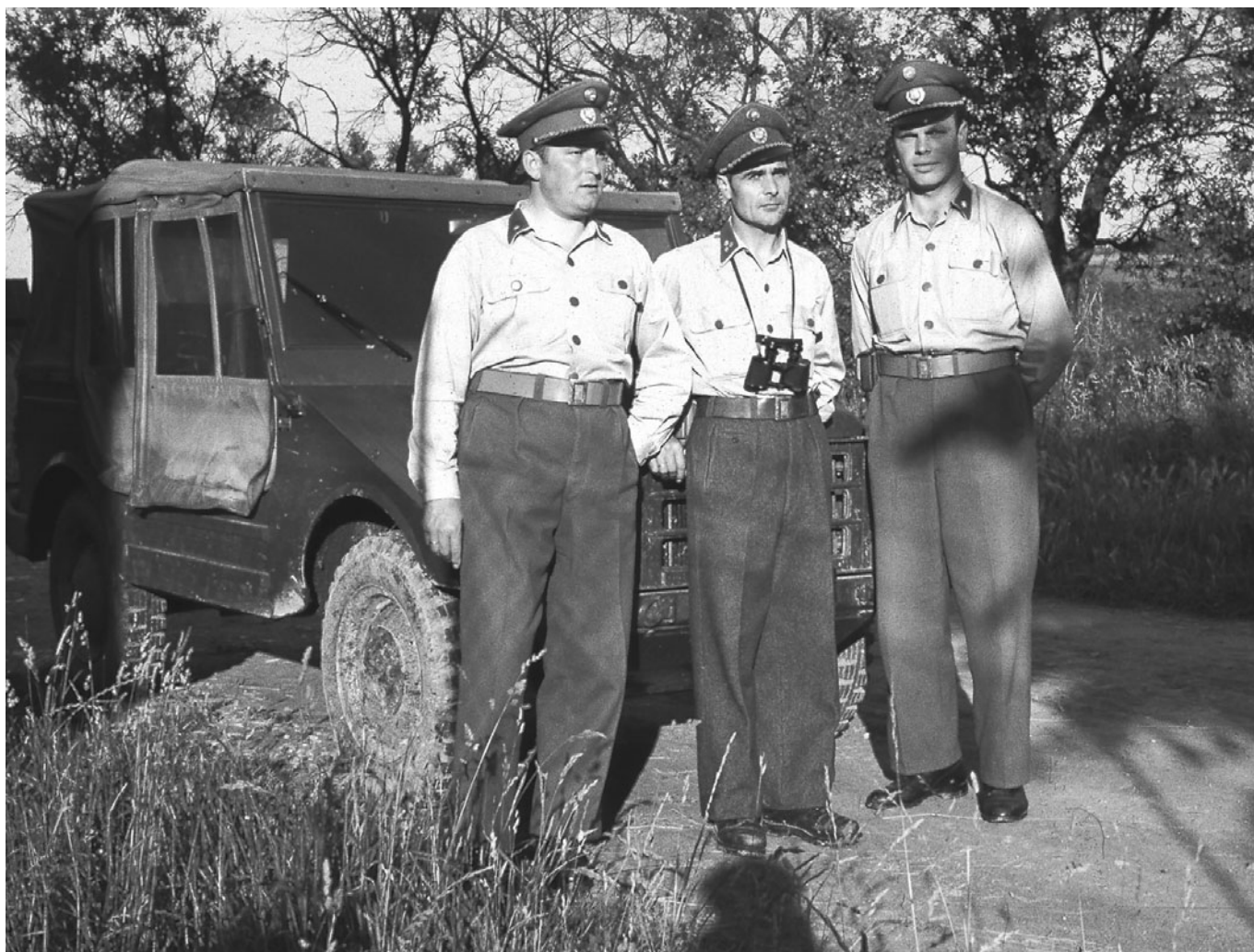
Mot-Streife mit einem DKW-Munga im Jahre 1959 im Burgenland

Abhaltung des 2. Vorbereitungslehrganges zur gehobenen Fachprüfung für die Zollwache (W 1-Kurs).