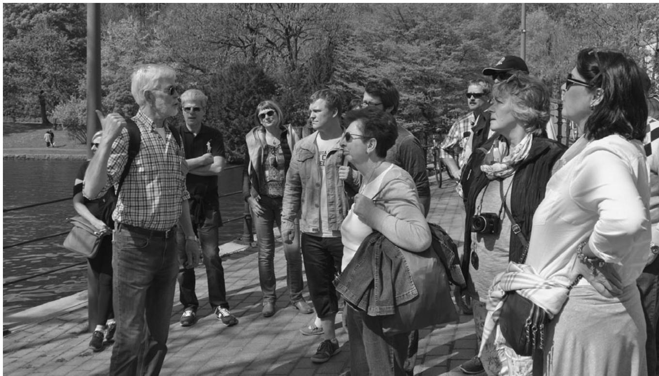
„Damals war die Welt noch in Ordnung“ Ausflug nach Lübeck im Jahre 2016

den Fluglinien und somit auf die Kosten für die Reisenden auswirken könnte.