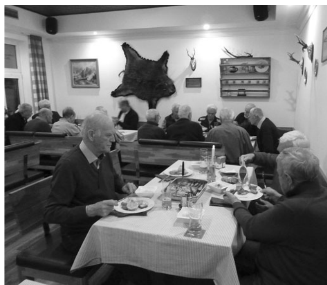
Wenn das Brat'l schmeckt . . .

Die Kosten für den Stammtisch haben wir mit dem Subventionsbeitrag des Verbandes sowie mit der „Ein Euro Spende“ pro Teilnahme am monatlichen Stammtisch beglichen. Diese Subvention wird leider durch den Mitgliederschwund durch Todesfälle und teilweiser Nichteinzahlung des Jahresbeitrages immer weniger.